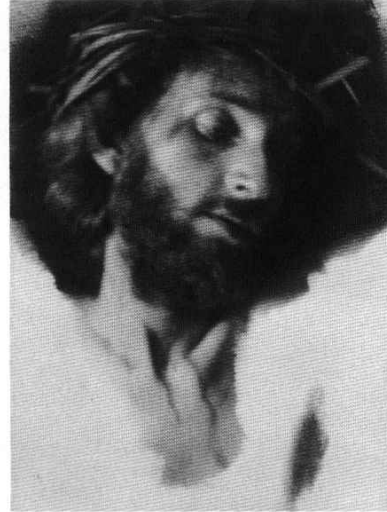
F. Holland Day "Woman, Behold Thy Son; Son, Thy Mother," 1898

Situado en un enclave excepcional, en el mismo centro más emocionante de la actividad posee la capacidad de transformar su cansancio, su estrés, su ajeteo diario y su hastío en un sinfín de instantes placenteros. Llame a las puertas de GRAN PUERTO LUZ, ya están abiertas para usted lo más cerca posible de usted. Mire y verá, entre y lo agradecerá. Oferta gratuita de lanzamiento indefinida. A un millón de Kms. de cualquier parque temático que haya visitado hasta ahora.. Gran Puerto Luz: en el centro mismo de su corazón.